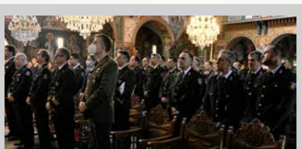
Από τους εορτασμούς που πραγματοποιήθηκαν από την Π.Υ. Κορίνθου

Ανάλογες εκδηλώσεις, πραγματοποιήθηκαν σε όλες τις έδρες των Περιφερειακών Διοικήσεων των Υπηρεσιών του Πυροσβεστικού Σώματος σε όλη την χώρα. 🇬🇷