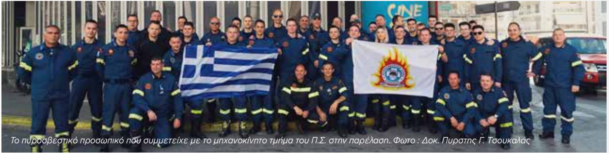
Το πυροσβεστικό προσωπικό που συμμετείχε με το μηχανοκίνητο τμήμα του Π.Σ. στην παρέλαση.

σαντίνος, μεταξύ άλλων, ανέφερε ότι: «Πέρασαν διακόσια δύο χρόνια από την ιστορική ημέρα που στην Ιερά Μονή Μεγίστης Λαύρας, ο Μητροπολίτης Παλαιών Πατρών Γερμανός κήρυξε την έναρξη της Επανάστασης ενάντια στον Οθωμανικό ζυγό, υψώνοντας το λάβαρο της Επανάστασης, με το σύνθημα «Ελευθερία ή Θάνατος!!!» Μάλιστα, η ελευθερία που σήμερα εκλαμβάνεται ως κάτι το δεδομένο, για πολλούς αιώνες παρέμενε όνειρο απατηλό. [...] Δεν ήταν όμως μόνον οι άνδρες ήρωες που ξεχώρισαν στις μάχες της Επανάστασης του 1821. Μεγάλη συνεισφορά στον Αγώνα είχαν και οι Ελληνίδες πρόγονοί μας».