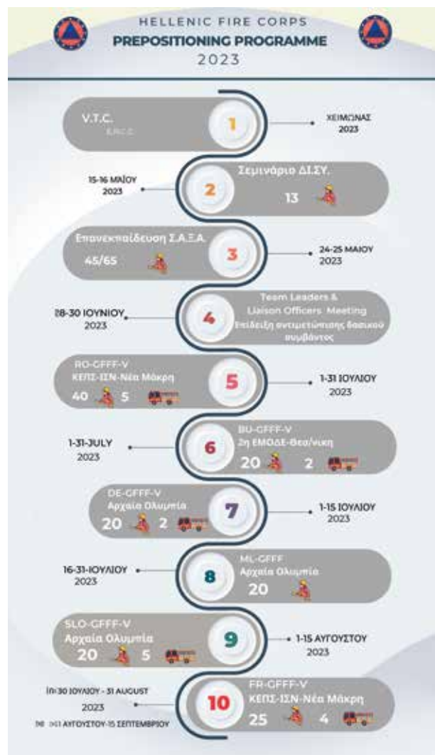
Canva' Timeline Infographic / LOCC-GR-23

• 64 Πυροσβέστες από τη Λετονία, Φινλανδία και Νορβηγία, προεγκαταστάθηκαν στην Πορτογαλία.