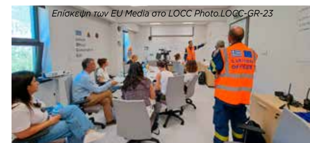
Επίσκεψη των EU Media στο LOCC Photo. LOCC-GR-23

Οι δυνάμεις αυτές απεικονίζονται στο σχετικό Χάρτη που εξέδωσε το Emergency Response Coordination Center του Ευρωπαϊκού Μηχανισμού. Επισμαίνεται ότι στον χάρτη απεικονίζεται η βοήθεια μόνο από τα Κράτη Μέλη, ενώ η Ελλάδα, σύμφωνα με τους Πίνακες, έλαβε βοήθεια και εκτός Ευρωπαϊκής Ένωσης.