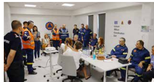
Επίσκεψη των EU Media στο LOCC Photo. LOCC-GR-23