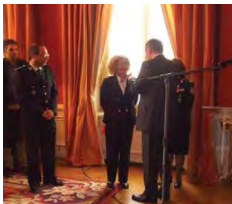
Βράβευση στη Γαλλική Πρεσβεία με το Χρυσό Μετάλλιο Εσωτερικής Ασφάλειας της Γαλλικής Δημοκρατίας, 3 Μαρτίου 2017