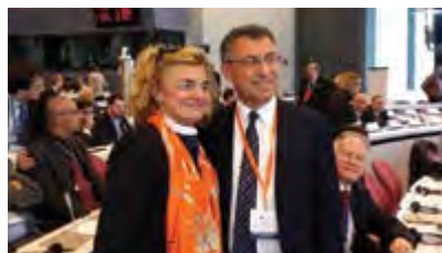
Με τον σημερινό Αντιπρόεδρο της Τουρκικής Κυβέρνησης Δρ. Fuat Oktay, ομόλογό της στην Πολιτική Προστασίας της Τουρκίας, 2015

στικού Σώματος και διετέλεσε τόσο σε επιχειρησιακές όσο και σε επιτελικές θέσεις, ως Τμηματάρχης και Διευ-