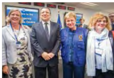
Επίσημα εγκαίνια του Ευρωπαϊκού Κέντρου Εκτάκτων Αναγκών με τον Πρόεδρο E. Vagozo και την Επίτροπο Ανθρωπιστικής Βοήθειας και Πολιτικής Προστασίας Cristalina Georgieva, Γενική Δ/ντρια Δ.Ν.Τ.

Α πό το 1977 η 8η Μαρτίου έχει οριστεί από τον Οργανισμό Ηνωμένων Εθνών ως Παγκόσμια Ημέρα για τα Δικαιώματα της Γυναίκας και τη Διεθνή Ειρήνη. Οι γυναίκες στο Πυροσβεστικό Σώμα απολαμβάνουν ίσης μεταχείρισης με τους άνδρες συναδέλφους τους. Έμπρακτη απόδειξη αυτού, είναι το γεγονός, ότι φέτος για πρώτη φορά στην ιστορία του, το Πυροσβεστικό Σώμα τίμησε με το βαθμό του Αρχιπυράρχου, γυναίκα. Η Δρ. Καλλιόπη Σαΐνη, Εθνική Εκπρόσωπος της Ελλάδας στην Ε.Ε. για θέματα Πολιτικής Προστασίας, έχει υπογράψει πολλά εθνικά σχέδια, ενώ ο σχεδιασμός για τη διασπορά των εναερίων μέσων δασοπυρόσβεσης που χαρακτήρισε από την ίδια πριν από σχεδόν δύο δεκαετίες, παραμένει ορόσημο στον επιχειρησιακό σχεδιασμό της αεροπυρόσβεσης και εξακολουθεί να ισχύει έως και σήμερα. Ήταν η πρώτη γυναίκα που κατετάγη ως μάχιμη Αξιωματικός του Πυροσβε-