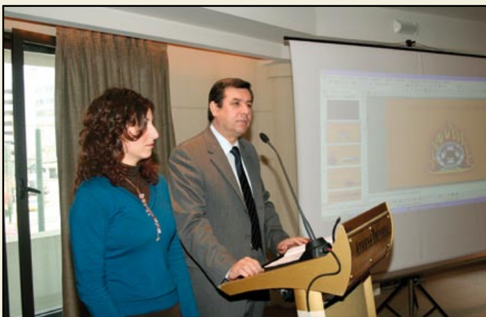
Ο Υπαρχηγός του Π.Σ. Αντιστράτηγος Γ. Καρδάρας απευθύνει χαιρετισμό, κατά την έναρξη των εργασιών της συνέλευσης της C.T.I.F.