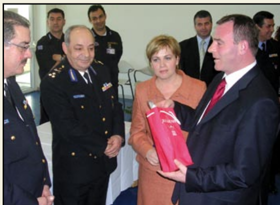
Από την τελετή λήξης του σεμιναρίου. Τα πτυχία επέδωσε στους συμμετέχοντες ο Αρχηγός του Π.Σ. Αντιστράτηγος Α. Κόης.