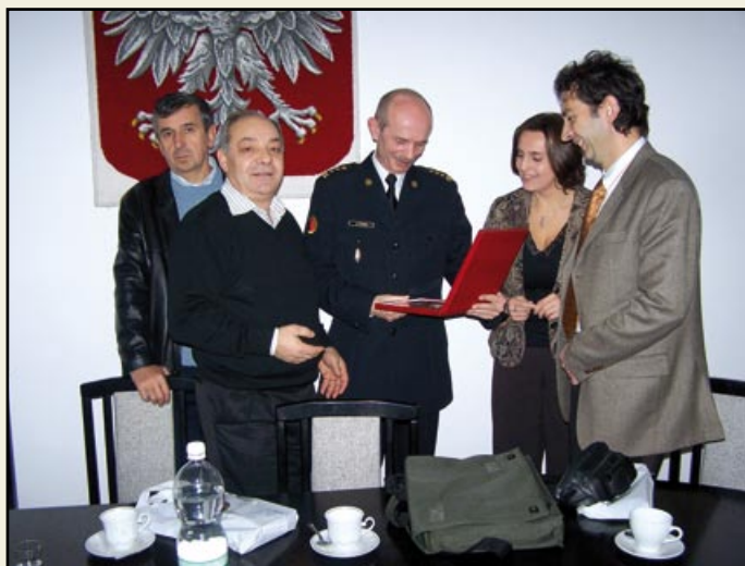
Κατά την επίσκεψη της ελληνικής αποστολής στο Αρχηγείο της Πυροσβεστικής στη Βαρσοβία, ο Αρχηγός του Π.Σ. Αντιστράτηγος Α. Κόης επέδωσε αναμνηστική πλακέτα στον Πολωνό ομόλογό του.

Βασικό συμπέρασμα της επίσκεψης στην Πολωνία, ήταν ότι, πέρα από τις ομοιότητες που παρουσιάζουν οι δύο υπηρεσίες στη διάρθρωση (εθνικό επίπεδο οργάνωσης – διοίκησης) και την αντιμετώπιση - διαχείριση των συμβάντων (καταστροφών), κοινή είναι επίσης η πεποίθηση, για τη σημασία και τη βαρύτητα του ρόλου της εκπαίδευσης. Για το λόγο αυτό, συμφωνήθηκε η υπογραφή πρωτοκόλλου συνεργασίας, για την ανταλλαγή εκπαιδευτικών προγραμμάτων και στελεχών, με σκοπό την προώθηση της συνεργασίας των δύο υπηρεσιών, τόσο σε διμερές όσο και σε ευρωπαϊκό επίπεδο.