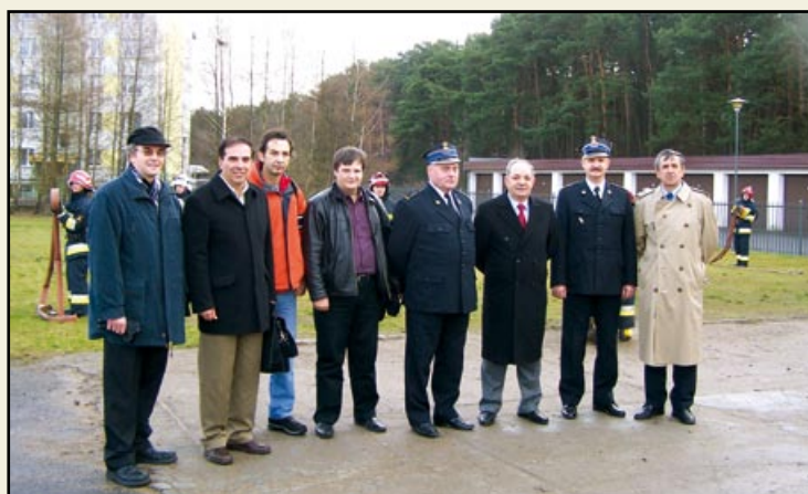
Από την επίσκεψη της ελληνικής αντιπροσωπείας στην Ακαδημία νέων Πυροσβεστών της πόλης Bydgoszcz.