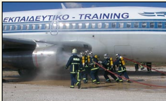
Στιγμιότυπο από την άσκηση κατάσβεσης πυρκαγιάς σε αεροσκάφος.

Στην τελετή λήξης του σεμιναρίου, παραβρέθηκαν, εκτός από τη φυσική ηγεσία του Σώματος, ο Αρχηγός της Π.Υ. Αλβανίας κ. Dilaver Lachi, καθώς επίσης ανώτατοι και ανώτεροι αξιωματικοί του Π.Σ.