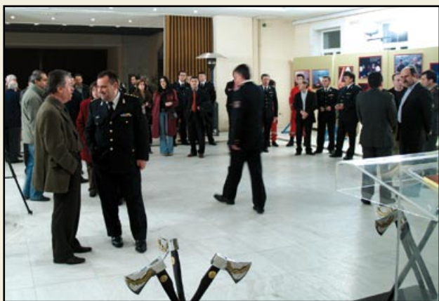
Από τα εγκαίνια της έκθεσης φωτογραφίας "Συνομιλώντας με τους Πυροσβέστες", που φιλοξενήθηκε στο Πνευματικό Κέντρο Τρίπολης.

Ιδιαίτερη εντύπωση προκάλεσαν στους επισκέπτες τα θέματα των φωτογραφιών, καθώς και τα σχόλια των προσωπικοτήτων, που τις συνόδευαν.