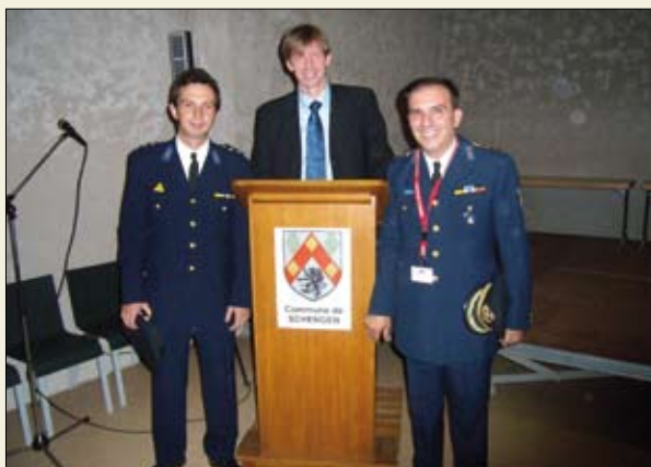
Από την επίσκεψη των μελών της επιτροπής της C.T.I.F., στην πόλη του Schengen.

Για μια ακόμη φορά, μέσα από τις επαφές με το σύνολο των στελεχών των χωρών που συμμετείχαν στη Γενική Συνέλευση της C.T.I.F., διαπιστώθηκε ο μεγάλος βαθμός προτεραιότητας που δίνεται στην οργάνωση και στήριξη των εθελοντικών πυροσβεστικών υπηρεσιών, θεσμός που ίσως θα πρέπει να εξεταστεί εκ νέου από την Υπηρεσία μας, τόσο ως προς το θεσμικό του πλαίσιο (προϋποθέσεις, κίνητρα κ.λπ.), όσο και ως προς την αποτελεσματικότερη συνδρομή των εθελοντικών οργανώσεων στο επιχειρησιακό έργο του Πυροσβεστικού Σώματος.