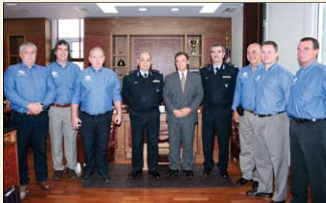
Ο Αρχηγός του Π.Σ. Αντιστράτηγος Α. Κόης και ο Υπαρχηγός Αντιστράτηγος Φ. Παππάς με τους Αυστραλούς εμπειρογνώμονες, που επισκέφθηκαν το Α.Π.Σ. και τον πρέσβη της Αυστραλίας στη χώρα μας κ. Ρ. Tighe.

Συνάντηση πραγματοποιήθηκε, στις 30 Οκτωβρίου, στο Αρχηγείο Πυροσβεστικού Σώματος, μεταξύ του Αρχηγού του Π.Σ. Αντιστράτηγου Ανδρέα Κόη και κλιμακίου Αυστραλών εμπειρογνομόνων, ειδικών σε θέματα δασικών πυρκαγιών, οι οποίοι συνοδεύονταν από τον πρέσβη της Αυστραλίας στην Ελλάδα κ. Paul Tighe. Κατά τη διάρκεια της συνάντησης, κύριο θέμα της