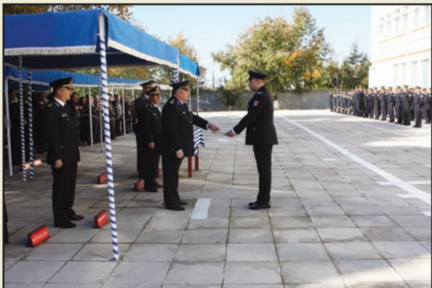
Τα πτυχία στους αποφοιτήσαντες επέδωσε ο Αρχηγός του Πυροσβεστικού Σώματος Αντιστράτηγος Στυλιανός Στεφανίδης.